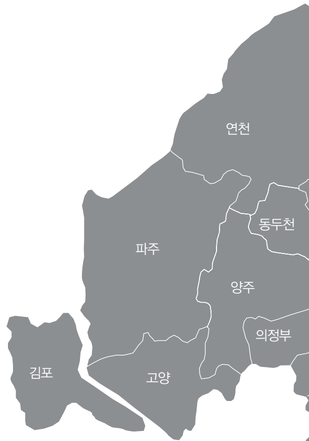
경기도교육청 지역별 학교 수