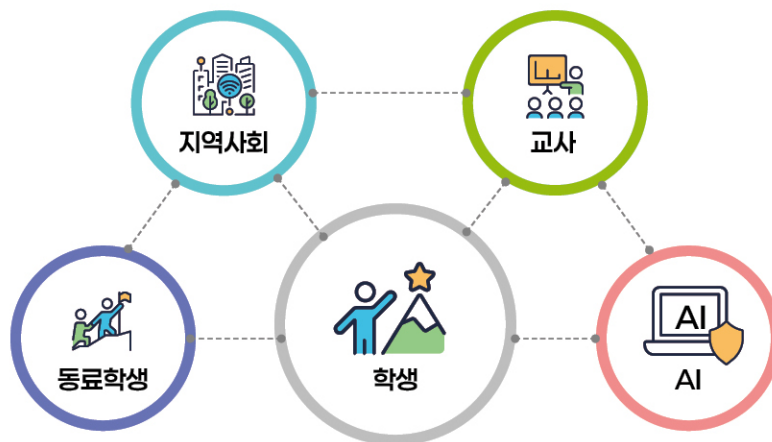
[다양한 공동 주도성]

학습자 주도성을 기르기 위해서는 교사, 동료 학습자, 지역사회, AI 등 다양한 주체가 상호보완적 역할을 수행하는 공동 주도성을 발휘해야 한다. 공동 주도성은 학생-학생, 학생-교사, 학생-교사-AI, 교사-교사, 교사-AI 등이 함께 가치 있는 목표를 향해 나아가며, 협력적 관계 속에서 서로의 학습과 변화를 이끌어 가는 역동적 과정이다.