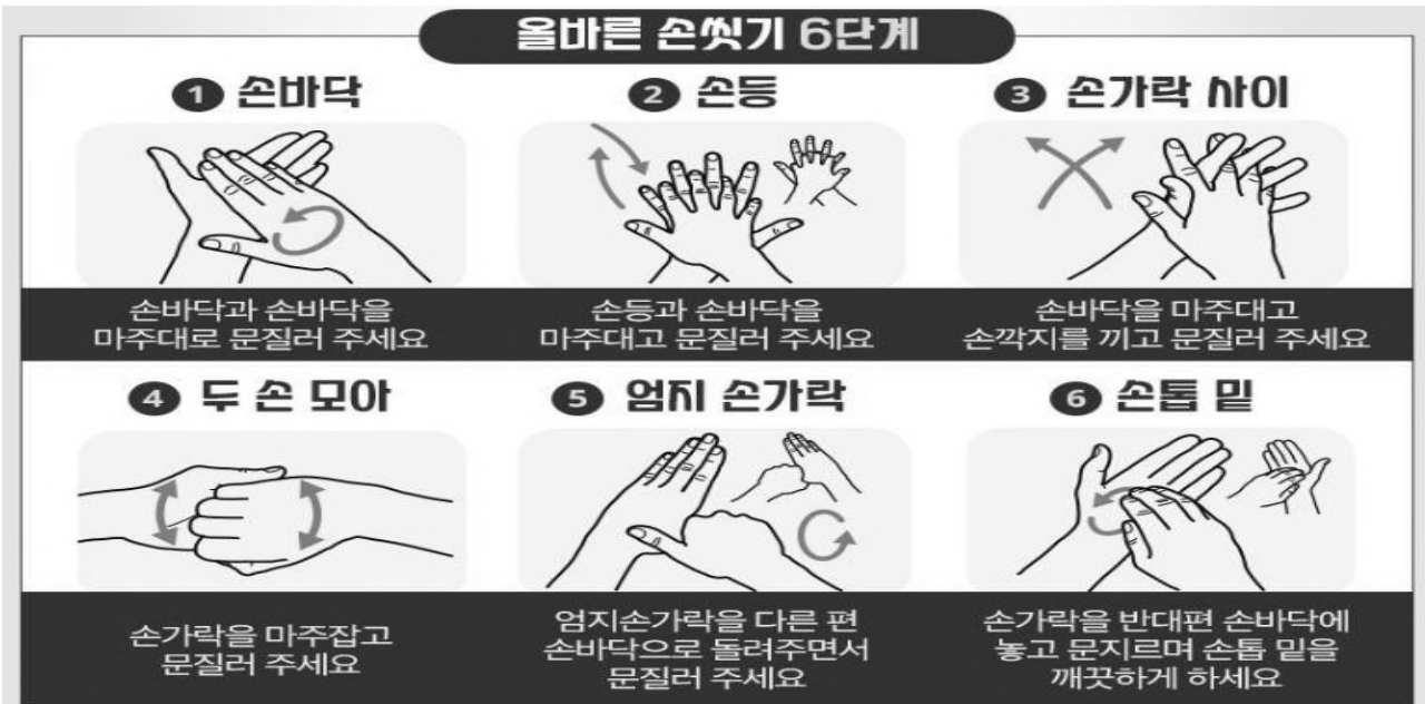
[그림1] 올바른 손 씻는 방법